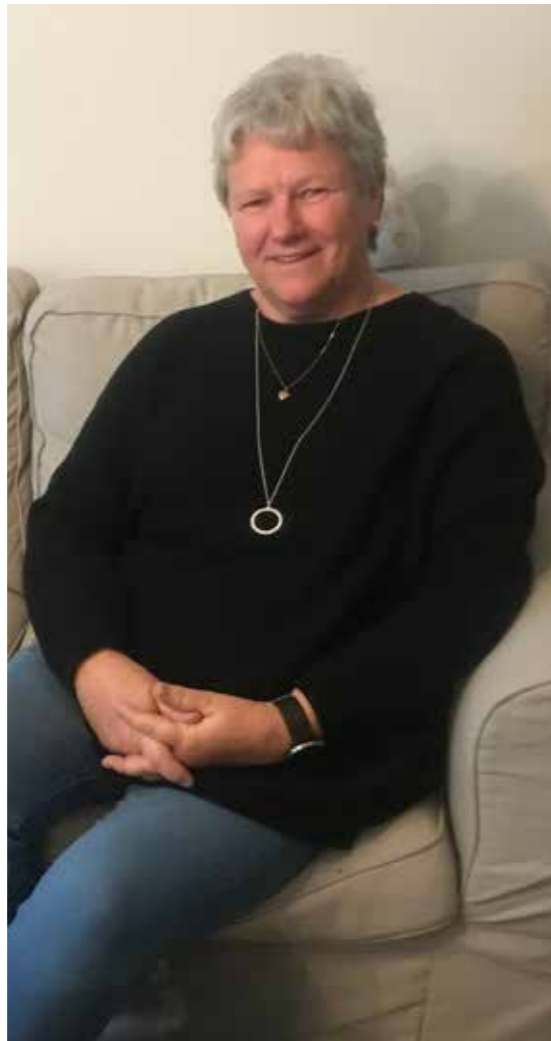
TEXT OCH BILDER: Hilkka Olkinuora TEKSTI JA KUVAT: Hilkka Olkinuora

Till den ensamme och/ eller fattige säger Birgitta: "Bli inte ensam!" och upprepar det många gånger under intervjun. "Vi har svårt att hitta till dig och hjälpa om vi inte ser dig. Om du inte orkar själv, kanske kan en granne, vän eller släkting ta kontakt å dina vägnar eller komma med dig; tröskeln här är låg och man behöver inget prester. Underskatta aldrig vad vänner kan göra!"