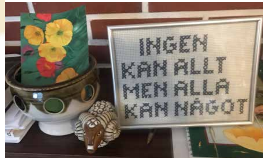
Alla kan bidra med något är diakonins verksamhetsmotto. "Kukaan ei osaa kaikkia, mutta kaikki osaavat jotain"

Yksinäiselle ja/tai varattomalle Birgitta sanoo: "Älä jää yksin!" monta kertaa haastattelun aikana. "Meidän on vaikea löytää sinut auttaaksemme, jos emme näe sinua. Jos et itse jaksa, ehkä naapuri, ystävä tai sukulainen voi ottaa puolestasi yhteyttä tai tulla mukaan; täällä kynnyksellä on alhainen eikä kenenkään tarvitse suorittaa mitään. Älä koskaan aliarvioi ystävien voimaa!"