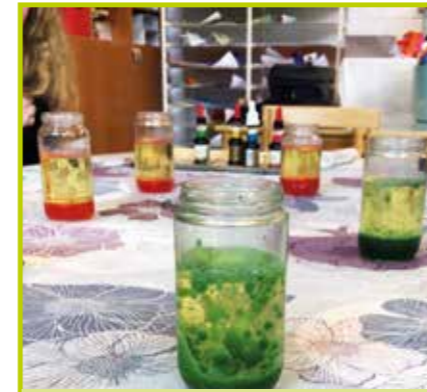
Einstein-klubbens roliga experiment. Einstein-kerhon hauskat kokeilut.