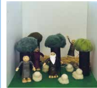
Herdarna på ängen / Paimenet niityllä