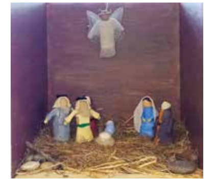
Jesu födelse / Jeesuksen syntymä