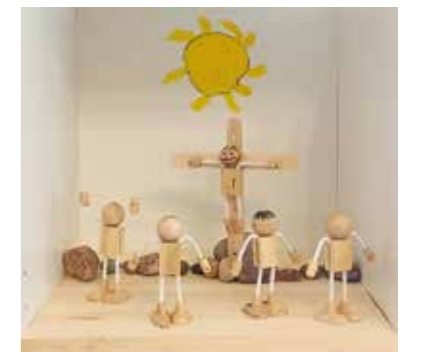
Korsfästelsen / Ristiinnaulitseminen