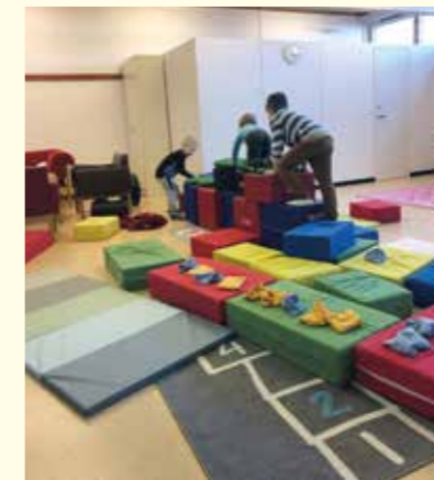
Full fart i dagklubben! / Täyttä vauhtia päiväkerhossa!