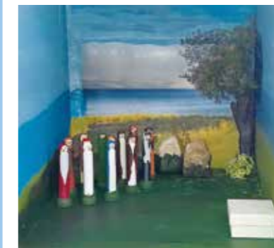
Brönduret / Leipäihme